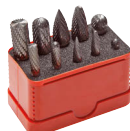
Typ FS SET 10 B