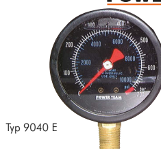
Typ 9040 E