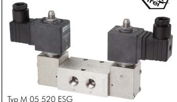
Typ M 05 520 ESG

Diese Ventile werden grundsätzlich mit Spule und Stecker ausgeliefert!