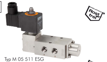
Typ M 05 511 ESG

24V= (Standard) . . . . .-24V= 230V AC (Standard) . . . . .-230V 24V AC . . . . .-24VAC 115V AV . . . . .-115V