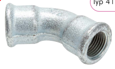
Typ 41 / G1-45°