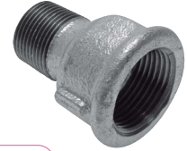
Typ 246/M4 red